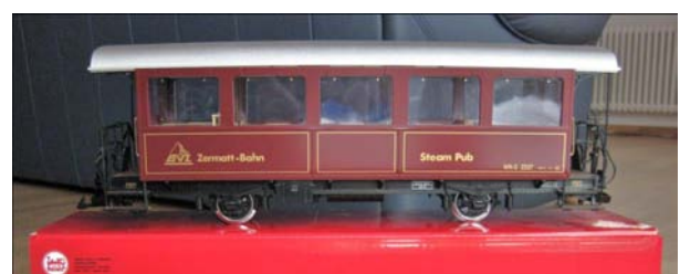
LGB, 31550, BVZ Passenger Car

Die Verlosung des LGB Wagens wurde während der Spielwarenmesse in Nürnberg abgehalten. Die Spannung stieg, als der Name gezogen wurde! Und der Gewinner ist: Herr Klaus Weinert! Der Wagen wird noch im Februar zugesandt und findet hoffentlich seine zweckmäßige Bestimmung in dessen Modellbahnanlage.